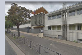
LYCEE FERNAND LEGER Ivry-sur-Seine