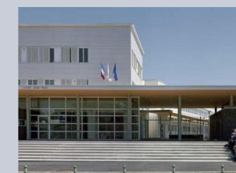
LYCEE JEAN MACE Vitry-sur-Seine