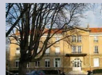
LYCEE ADOLPHE CHERIOUX Vitry-sur-Seine