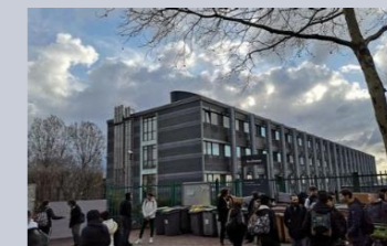
LYCEE ROMAIN ROLLAND Ivry-sur-Seine